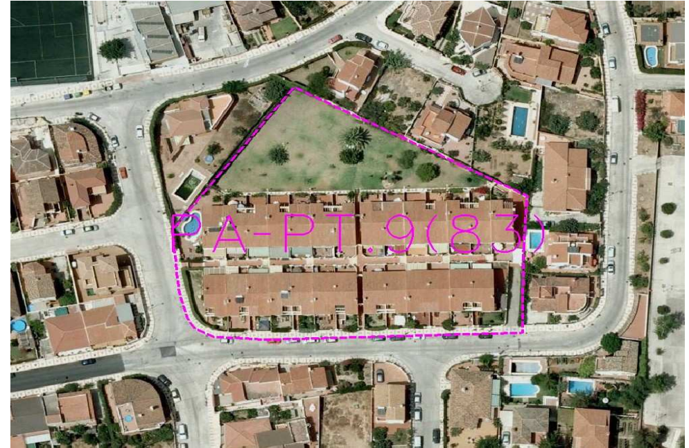
Ordenación Pormenorizada Completa